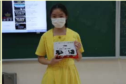
English Karaoke Competition