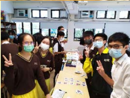
In love with board games

本校設有英語天地，老師經常在此舉辦各種英語活動，同學亦可利用小息或課餘時間，在英語天地與好友進行桌上遊戲，和閱讀英文書籍，在愉快輕鬆的環境下學習英語。