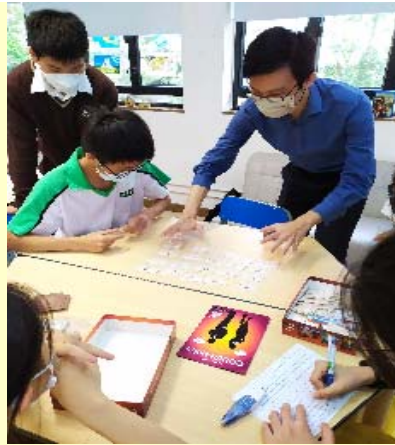
Board Games Taster Session