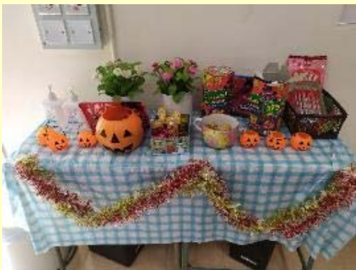
English Corner comes to life